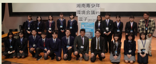
前回2023年3月25日実施 参加校11校